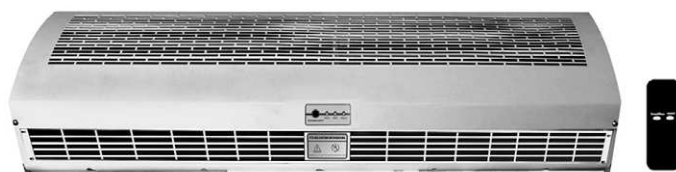
Mod. con Calefacción