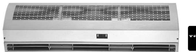
Mod. Sólo Aire