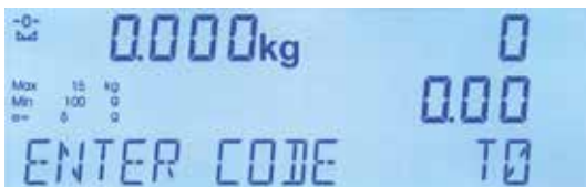
Display LCD retroiluminado